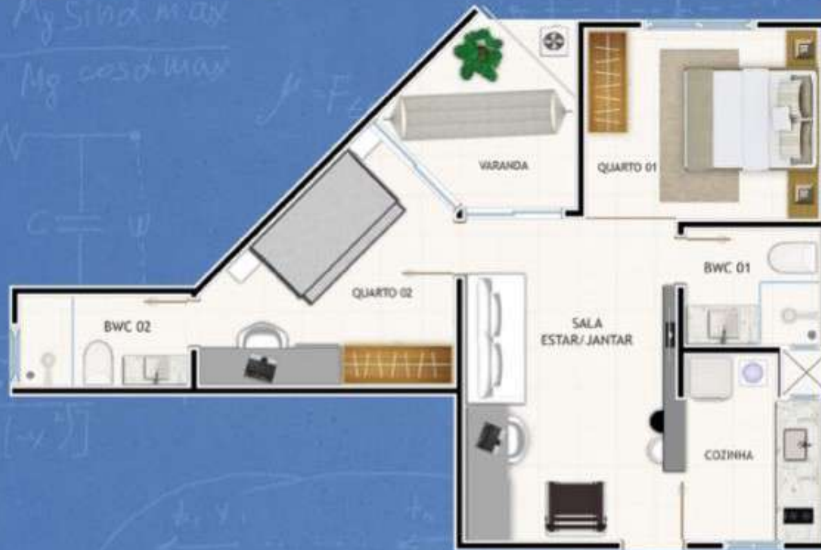
Planta Apartamento Suite