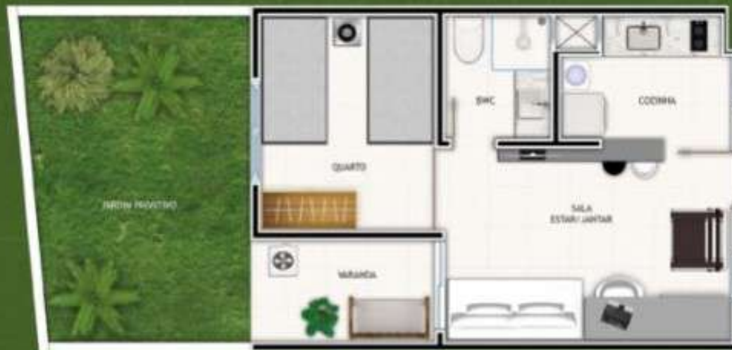
Planta Apartamento Tipo