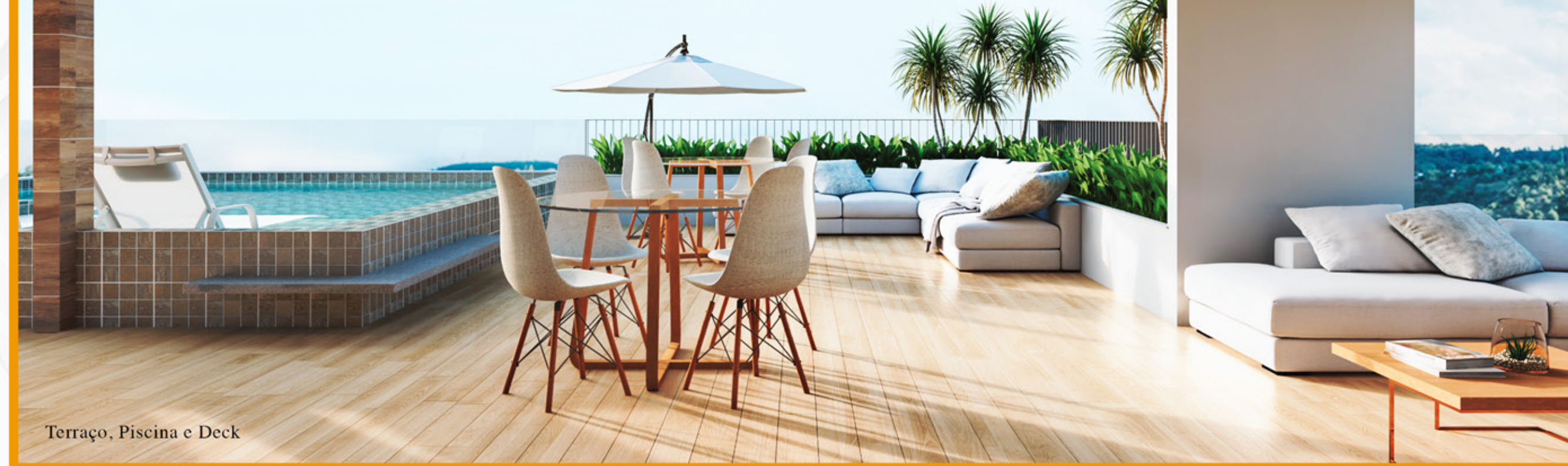
Terraço, Piscina e Deck

O The Home – Petrópolis oferece grandes modernidades tecnológicas em sua estrutura ao mesmo tempo em que traz à tona o conceito de empreendimento sustentável, com produtos, serviços, diretrizes políticas e atitudes que têm o objetivo de causar o menor dano possível ao meio ambiente. Tudo isso com diferenciais que o torna uma excelente opção para quem quer morar e também para quem deseja investir.