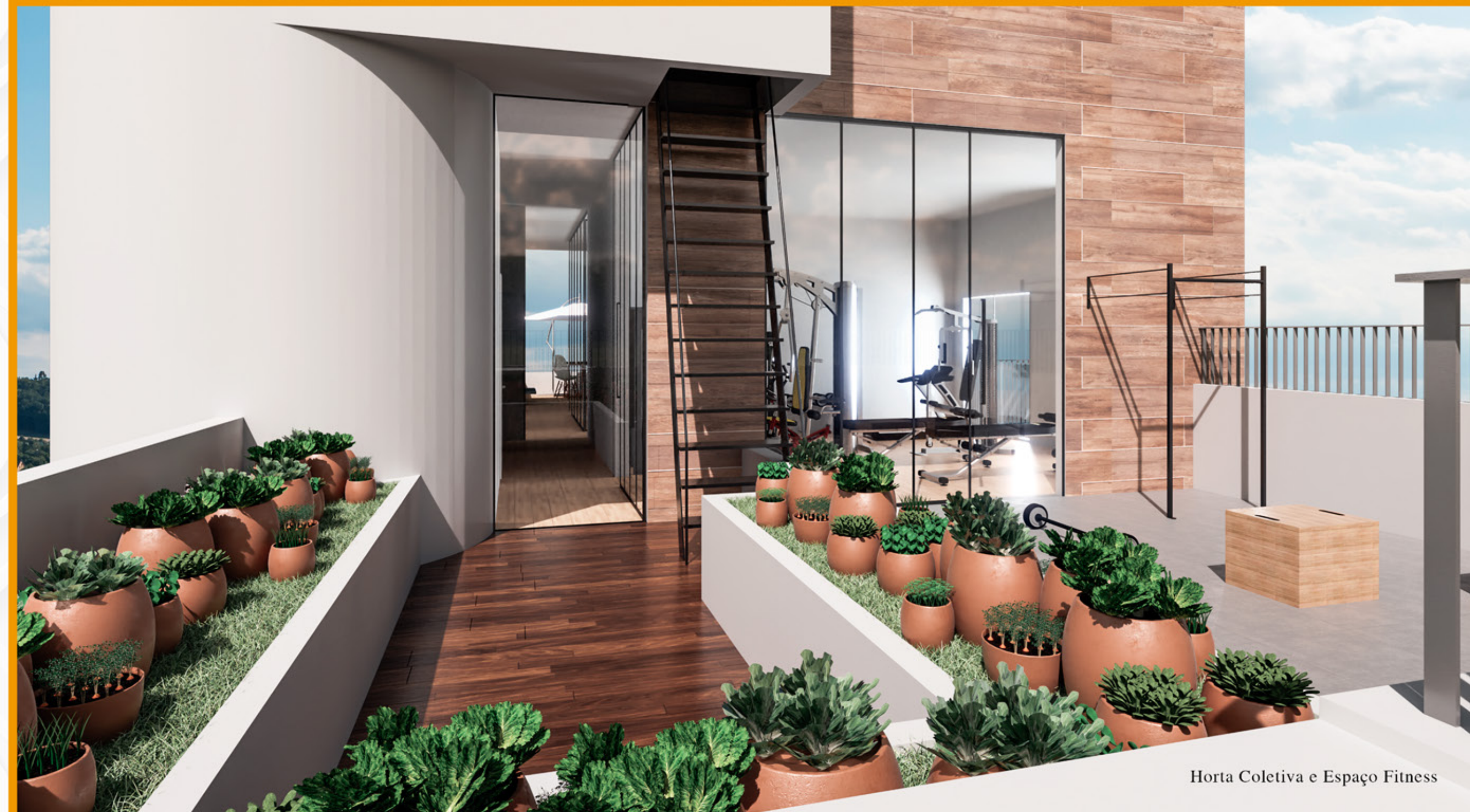
Horta Coletiva e Espaço Fitness