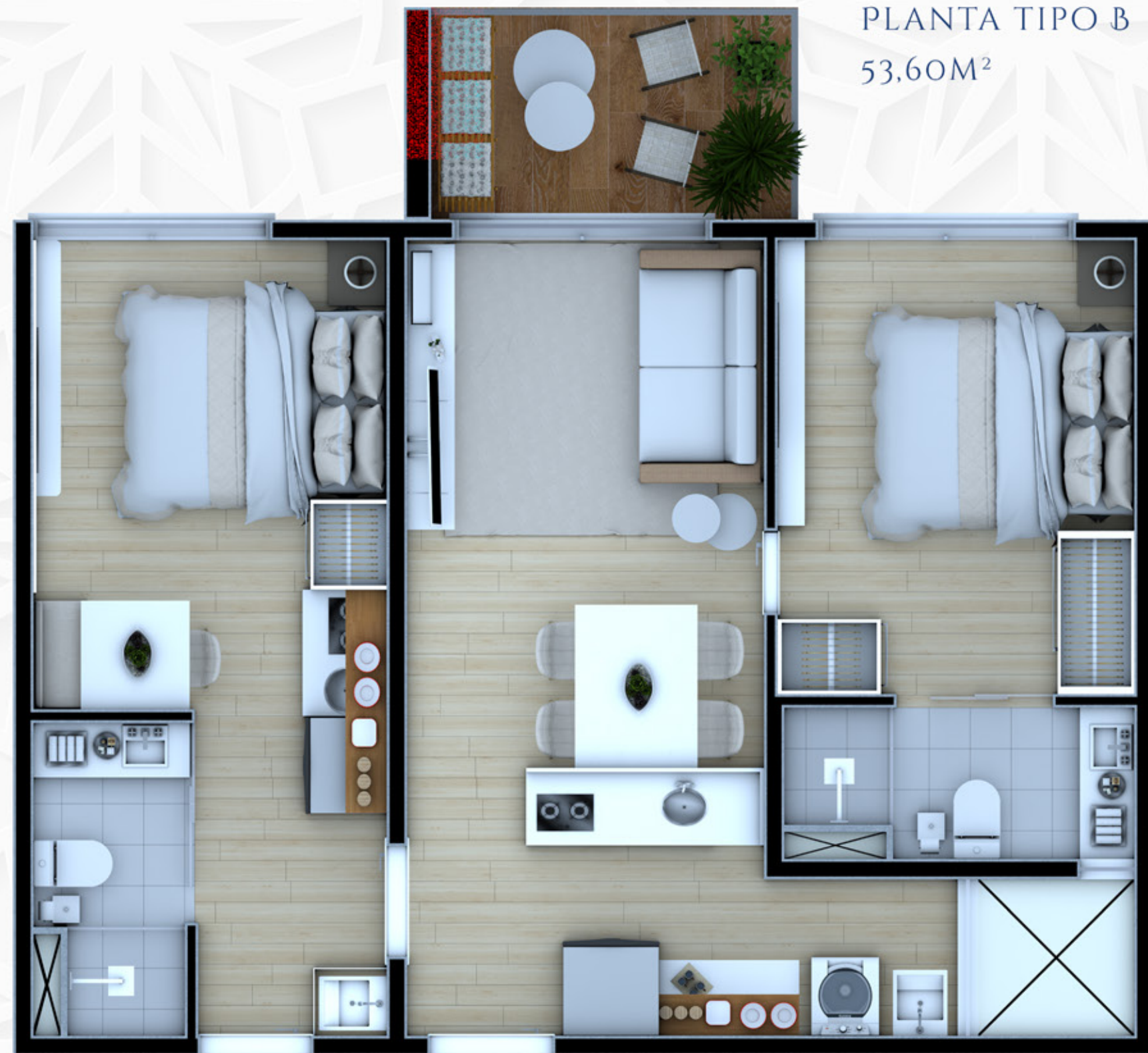
PLANTA TIPO B 53,60M 2

INDEPENDENTE PARA ONDE DÁ A VISTA DA VARANDA, TODAS APONTAM PARA A SUA SATISFAÇÃO.