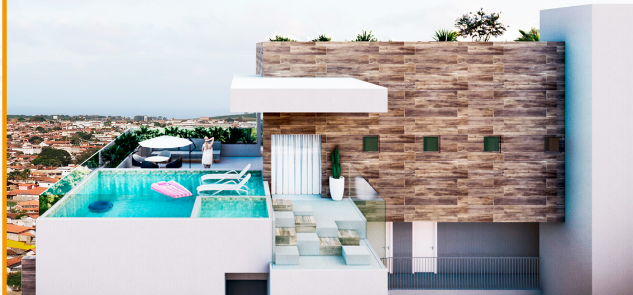
Belvedere para contemplar o belo pôr do sol do Rio Potengi